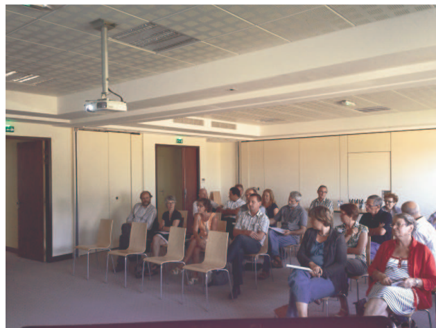
SCoT Laval Loiron – Notice de présentation Enquête publique (du 23 décembre 2013 au 27 janvier 2014)